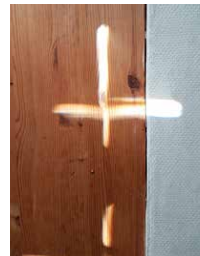
Gott lässt sich überall entdecken – auch im Sonnenlicht der Haustür.